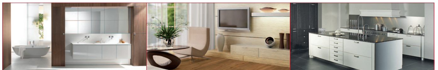
Bad & Heizung