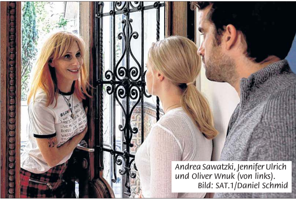
Andrea Sawatzki, Jennifer Ulrich und Oliver Wnuk (von links).

Sindelfingen: Dreharbeiten für Sat-1-Komödie „Es bleibt in der Familie“ mit Schauspielerin Andrea Sawatzki